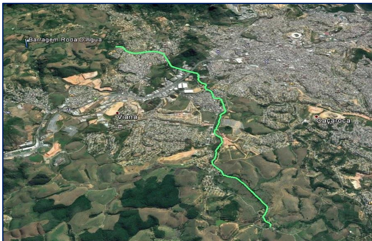
Figura 13: Seguimento do Rio Formate Projetado

A figura a seguir ilustra a localização da Barragem Roda D'água e dos 9 km de intervenção no Rio Formate conforme projetado.