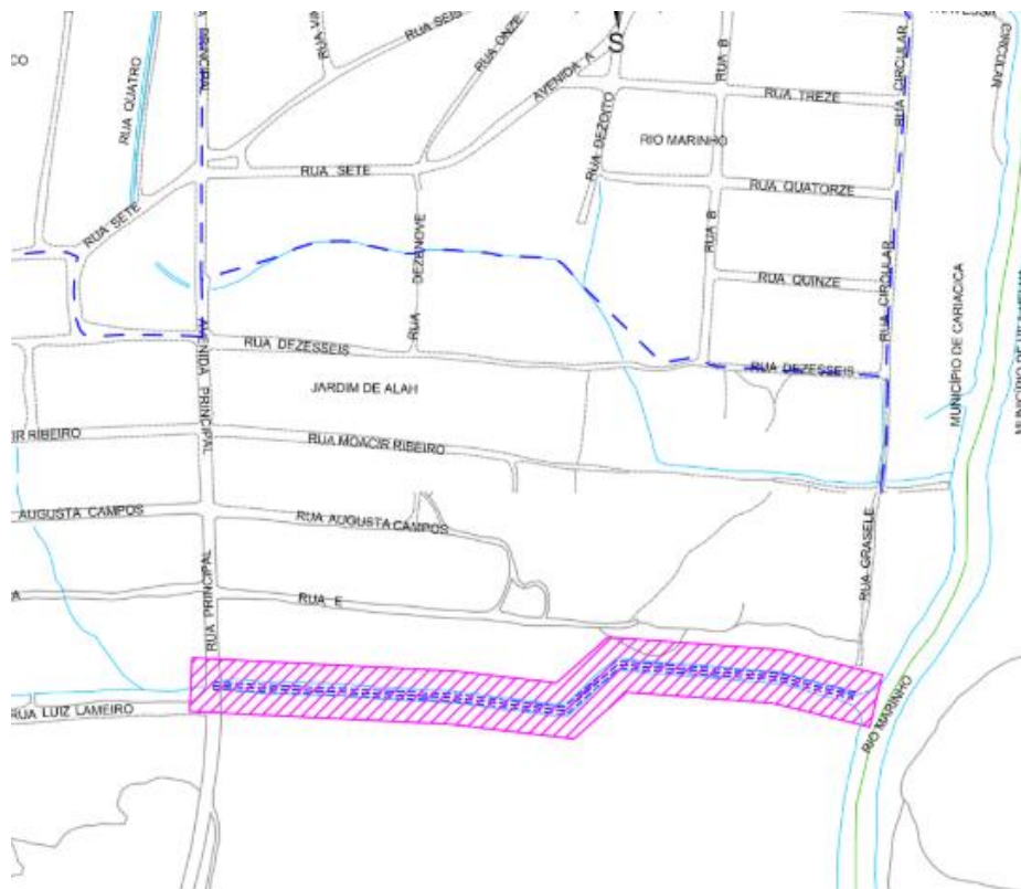
Figura 2 – Localização Galeria Jardim de Alah trecho II

GOVERNO DO ESTADO DO ESPÍRITO SANTO Secretaria de Saneamento, Habitação e Desenvolvimento Urbano