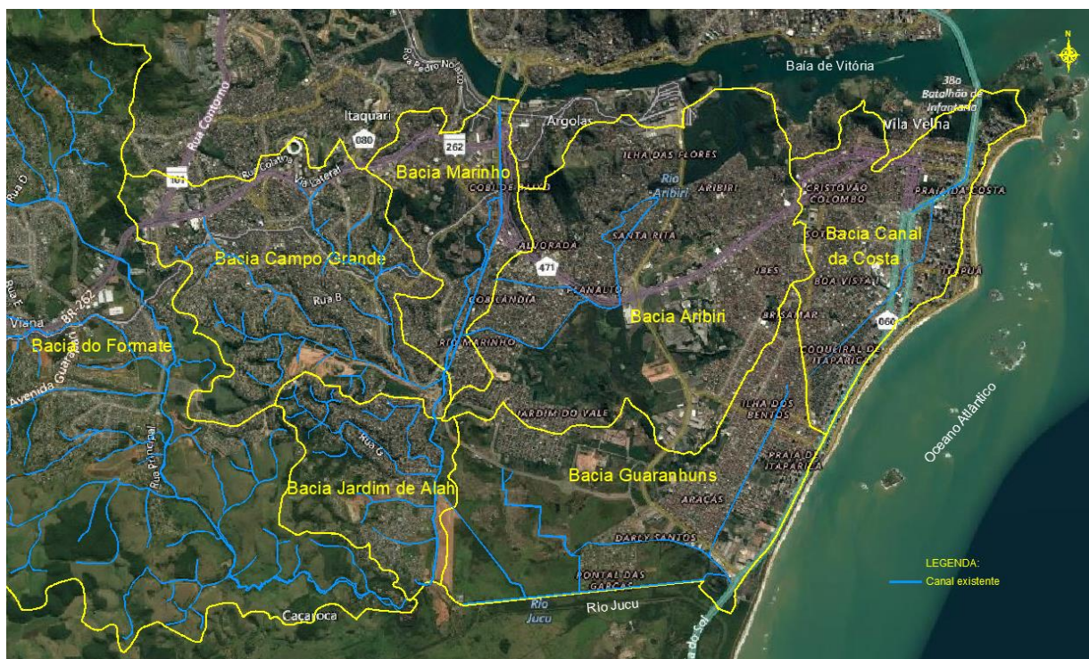
Figura 1: Representação das bacias hidrográficas dos municípios de Vila Velha e Cariacica.

Desde a metade do século XX, as áreas urbanas brasileiras estão cada vez mais adensadas. Como consequência, ocorreram ocupações irregulares em áreas de preservação próximas às margens de córregos e lançamento de efluentes, bem como o aumento das áreas impermeáveis. Essas ocupações obstruíram canais existentes, aumentaram a contribuição de resíduos e despejos nestes corpos hídricos.