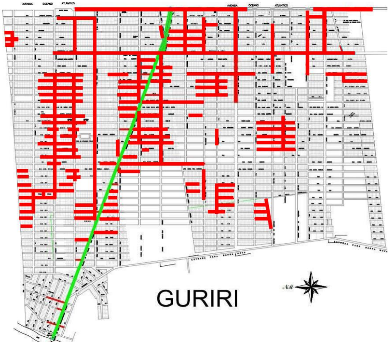
Figura 02 – Pontos de alagamento